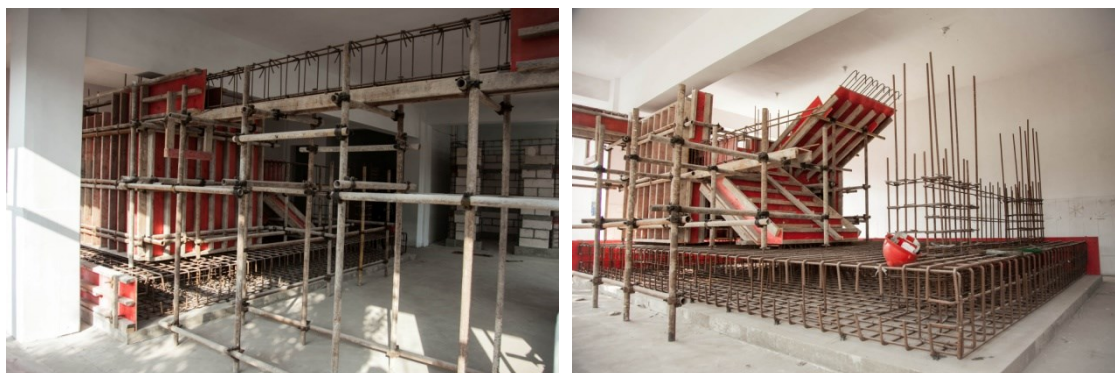
图 3 企业工作站实训场景

该企业工作站拥有模板工程、钢筋工程、门窗工程、屋面工程的标准化工作车间，学生在该企业工作站的实习实训，可有效的提高学生的工种操作技能及质量管理水平。