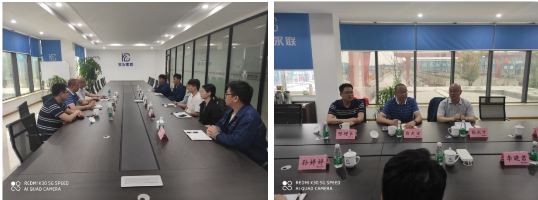
图 4 企业与学院教务处、教学督导探讨人才培养