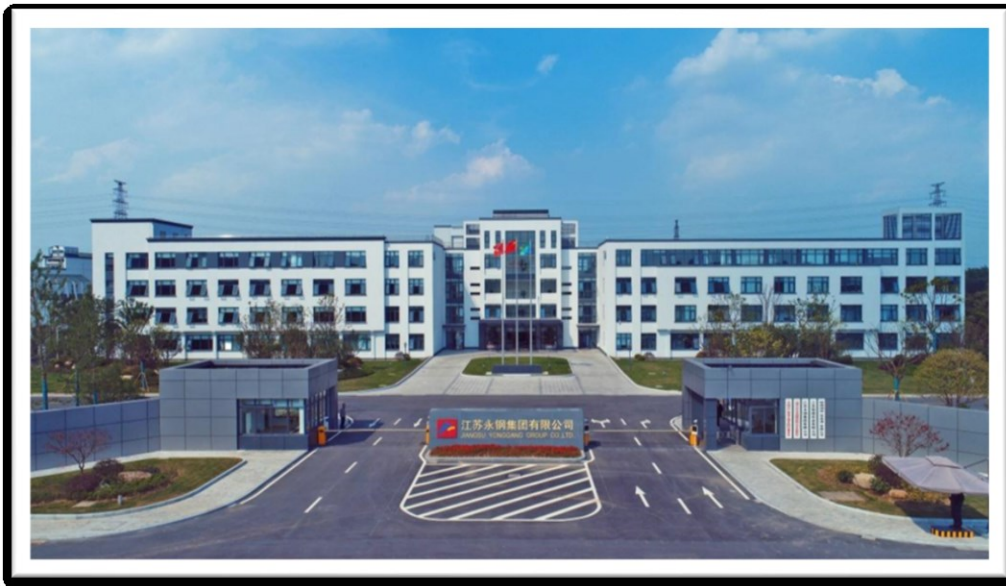
图 1 江苏永钢集团有限公司

江苏永钢集团有限公司（简称“永钢集团”），总部位于江苏省张家港市南丰镇永联村，始创于 1984 年。经过 30 多年的发展，现在是一家以钢铁为主业，金融贸易、建筑建材、装备制造、循环经济、新能源等多元产业协调发展的综合性企业集团。有员工 13000 余人，2020 年营业收入 1010 亿元，在中国企业 500 强中排名第 220 位。党的十八大以来，永钢集团深入贯彻新发展理念，实现高质量发展。推进供给侧结构性改革，研发生产的普、优、特钢产品国内销往 28 个省区市，国外销往 112 个国家和地区，其中 32 个“一带一路”沿线国家和地区，应用于建筑、交通、能源等领域，港珠澳大桥、“迪拜眼”摩天轮、新加坡滨海湾金沙酒店等知名工程。加强生态文明建设，获国家工信部“绿色工厂”“绿色供应链管理示范企业”认定，被国家节能中心评为“推动绿色发展示范基地”，被国际能源基金会评为“气候领袖企业”。积极履行社会责任，2012 年以来累计上交税收达 138 亿元，解决就业 1 万余人次，还积极助力永联村乡村振兴，参与脱贫攻坚、拥军优属、无偿献血等工作，被授予“中华慈善奖”等荣誉。